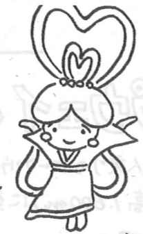
羽衣伝説の天女 「天人峡子」