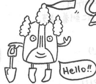
天人峡温泉の 守り神「ハゴロモン」